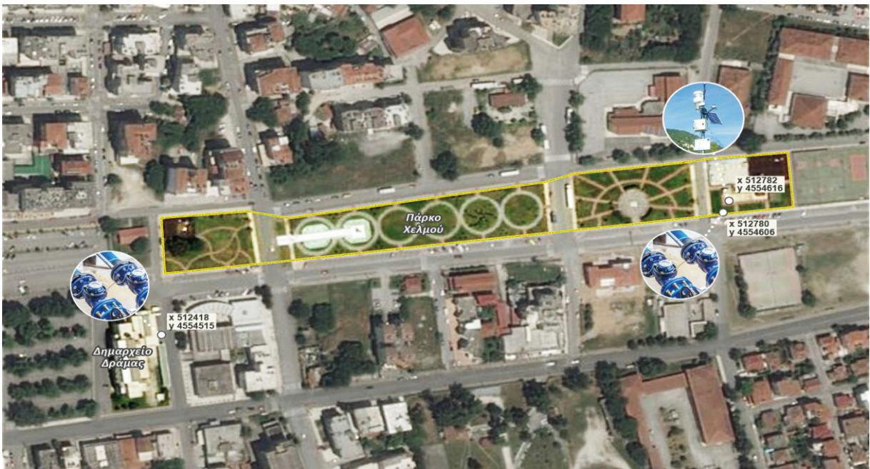
(Εικ.1 Χάρτης της περιοχής του πάρκου Χελμού)

Ο εξοπλισμός θα χρησιμοποιηθεί για την υλοποίηση της πιλοτικής δράσης του έργου στον Δήμο Δράμας. Η περιοχή μελέτης βρίσκεται στο Πάρκο της οδού Χελμού, στην περιοχή της ανάπλασης του ρέματος Καλλιφύτου, που βρίσκεται σε κοντινή απόσταση από το κτίριο του Δημαρχείου Δράμας και απεικονίζεται στην Εικόνα 1.