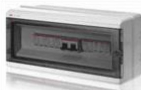
Σχήμα 6: Ενδεικτική μορφή πίνακα DC

Όλες οι καλωδιώσεις που θα αναχωρούν από τα ΦΒ πλαίσια, θα διαθέτουν προδιαγραφές καταλληλότητας τόσο για την μέγιστη τάση του συστήματος όσο και για συνεχή έκθεση στην ηλιακή ακτινοβολία και θα κατευθύνονται προς έναν πίνακα συνεχούς ρεύματος DC (String Boxes). Εντός του πίνακα DC (ενδεικτική μορφή στο σχήμα 6) θα εμπεριέχονται : διακόπτης φορτίου και απαγωγέας κρουστικών υπερτάσεων DC για την προστασία του αντιστροφέα. Ολόκληρο το ραγοϋλικό στην DC πλευρά θα διαθέτει προδιαγραφή λειτουργίας σε τάσεις μέχρι και 1000Vdc για λόγους ασφαλείας της εγκατάστασης.