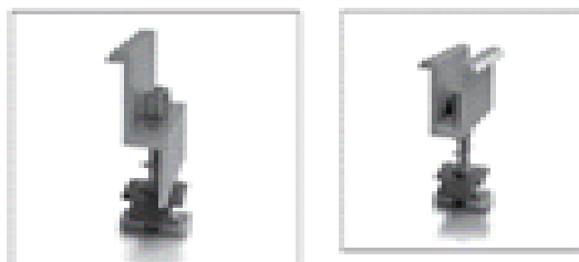
Σχήμα 4: Ακραίος συγκρατητής (αριστερά) - Ενδιάμεσος συγκρατητής (δεξιά)

Στο σχήμα 4 παρουσιάζονται ο ενδιάμεσος συγκρατητής (δεξιά) και ο ακραίος συγκρατητής (αριστερά).