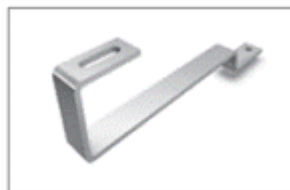
Σχήμα 2: Αγκύριο Στήριξης

Οι αποστάσεις στις οποίες θα εγκατασταθούν τα αγκύρια θα είναι υπολογισμένες από πολιτικό μηχανικό για κάθε κατοικία ξεχωριστά, ανάλογα με την περιοχή εγκατάστασης του συστήματος και τα περιβαλλοντικά δεδομένα. Τα φορτία αντοχής των βάσεων θα πρέπει να είναι τουλάχιστον 0,75 kN/m 2 για χιόνι και 0,80 kN/m 2 για άνεμο. Ο τύπος των αγκυρίων παρουσιάζεται στο σχήμα 2.