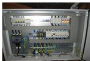
Σχήμα 7: Ενδεικτική μορφή πίνακα ΧΤ

Η σύνδεση τόσο του θετικού όσο και του αρνητικού πόλου της ομάδας πλαισίων με τον αντιστροφέα, θα υλοποιείται μέσω μονοπολικού καλωδίου. Όλες οι καλωδιώσεις που θα συνδέονται στον αντιστροφέα θα οδεύουν εντός πλαστικού σωλήνα βαρέως τύπου.